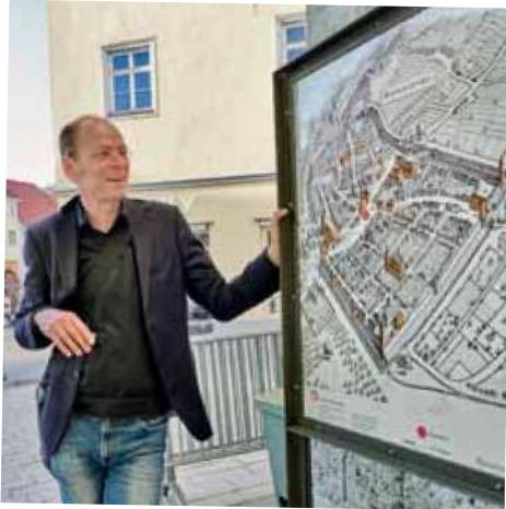
Ravensburg auf der Landkarte und in echt: Die Stadt mit ihren 17 Türmen und Toren begeistert gross und klein.